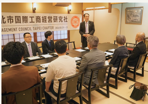
台北IMCとの調印式の様子

5月29日〜31日にかけて「社団法人台北市国際工商経営研究社(台北IMC)」の方々が来県し「包括連携協力に関する協定」を締結しました。