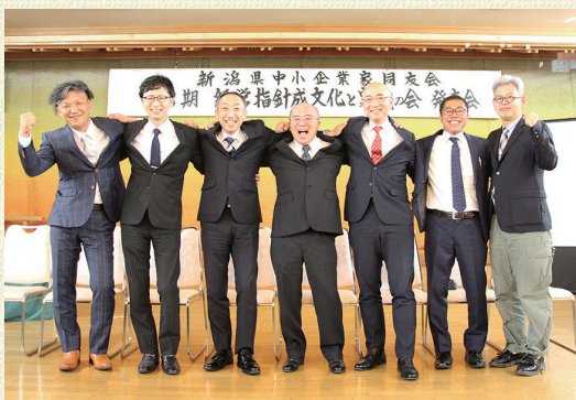
2022年の経営指針発表会

私にとって同友会は、たくさんの尊敬できる経営者との交流ができ、学びあい、自身の成長に欠かせない存在です。今日社の課題は、「後継者の育成」と、人を生かす経営の実践。異業種と比べると少し特殊な労働環境のため、どのように進めていくのがいいのか、模索しながら、まだまだ学んでよりよい実践をしていきたいと考えています。