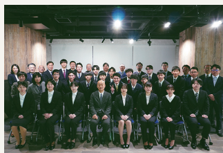
2024年度新入社員研修