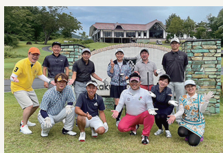
例会・ゴルフ交流会での写真